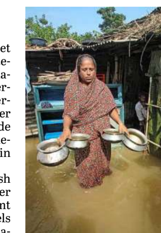
Overal is water, maar geen druppel om te drinken.

De situatie in Bangladesh wordt verergerd door water dat naar beneden stroomt vanuit omringende heuvels in de Indiase staat Meghalaya. In deze staat is 134 procent meer regen gevallen dan het gemiddelde in juni.