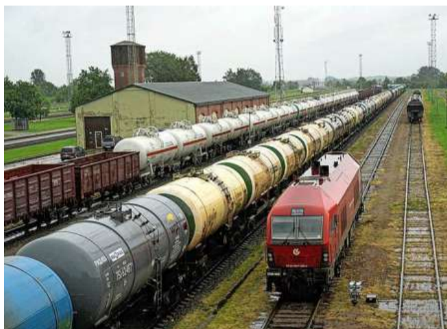
Een lange Russische vrachttrein staat klaar bij de Russisch-Litouwse grens in Kybartai.

BRUSSEL De spanningen rond de Russische exclave Kaliningrad lopen op. Moskou slaat dreigende taal uit richting Litouwen. Experts kijken bezorgd naar de 'Suwalki-corridor', misschien wel de 'gevaarlijkste plek' van Europa.