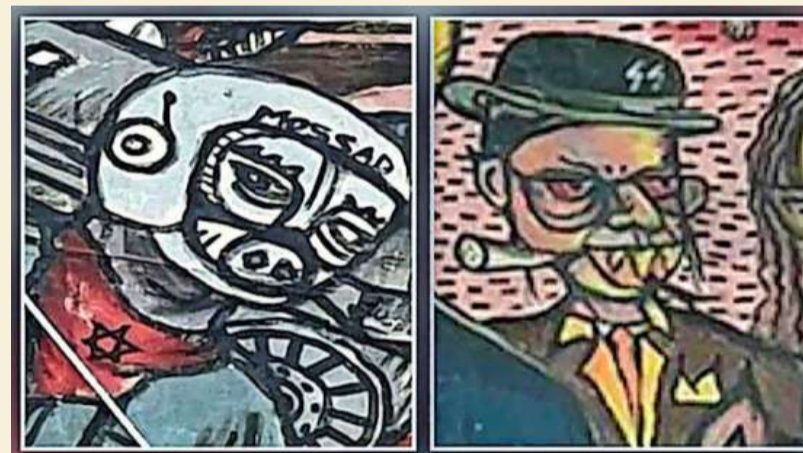
De antisemitische afbeeldingen, onderdeel van een grote schilderij, waar de ophef over is ontstaan.

Op hun metersgrote schilderij is een persoon