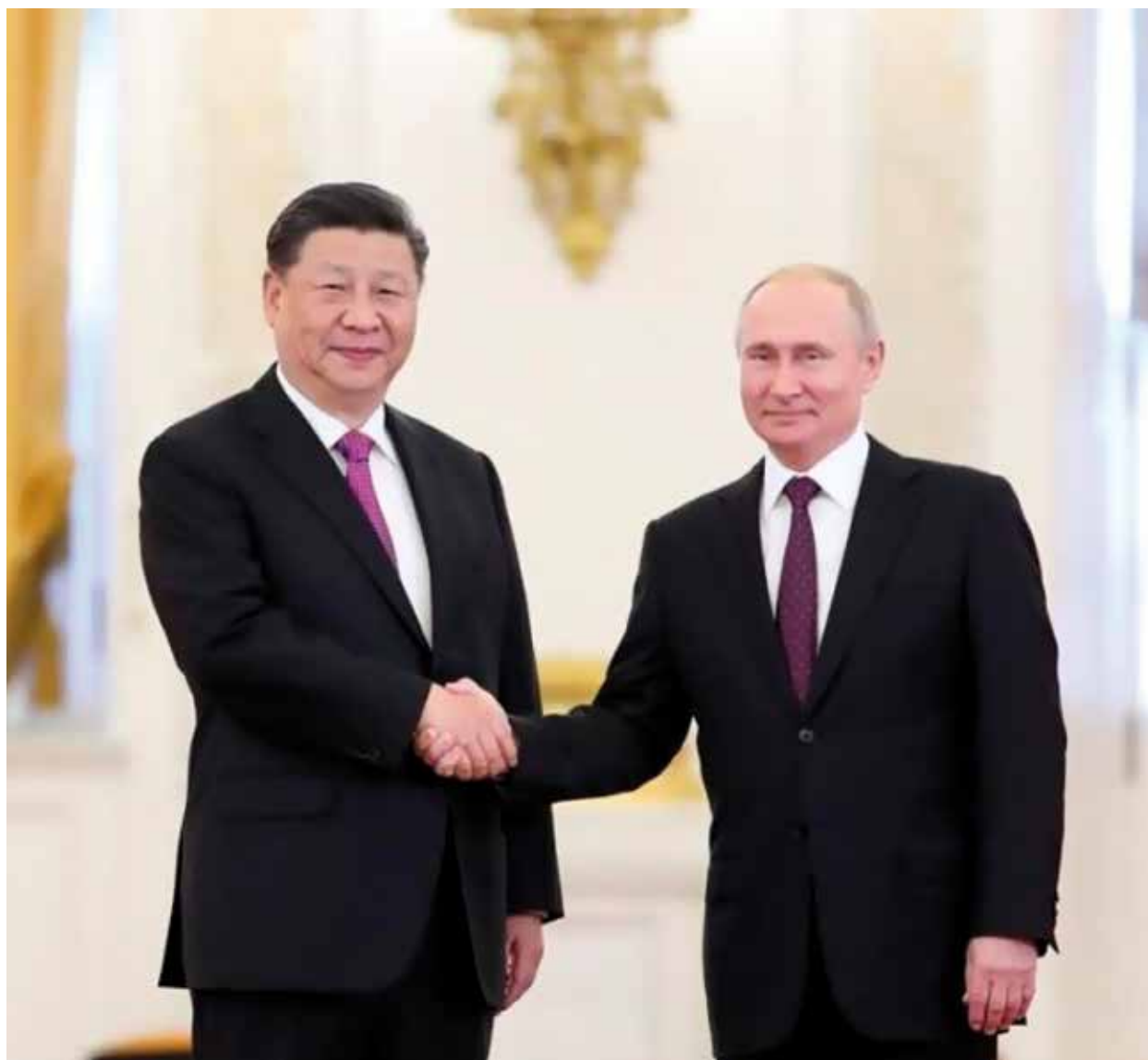
Presidenten Xi en Poetin